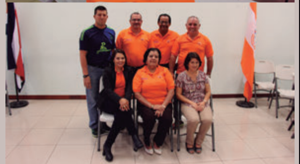
Comité de Educación